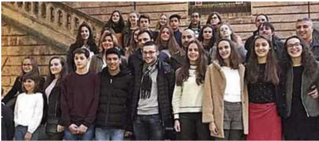
Algunos de los premiados posan con Miralles y Portells. consell

El Consell de Mallorca realizó el martes un acto de reconocimiento a 62 deportistas en edad escolar de diez federaciones de las Islas en un acto celebrado en el patio de La Misericordia. Según informó el Departamento insular de Cultura, Patrimonio y Deportes en un comunicado, todos ellos han hecho podio en competiciones nacionales o internacionales en los últimos meses en disciplinas diversas como baloncesto, baile deportivo, ajedrez, deportes adaptados, golf, pádel, patinaje, tiro olímpico, natación y vela.